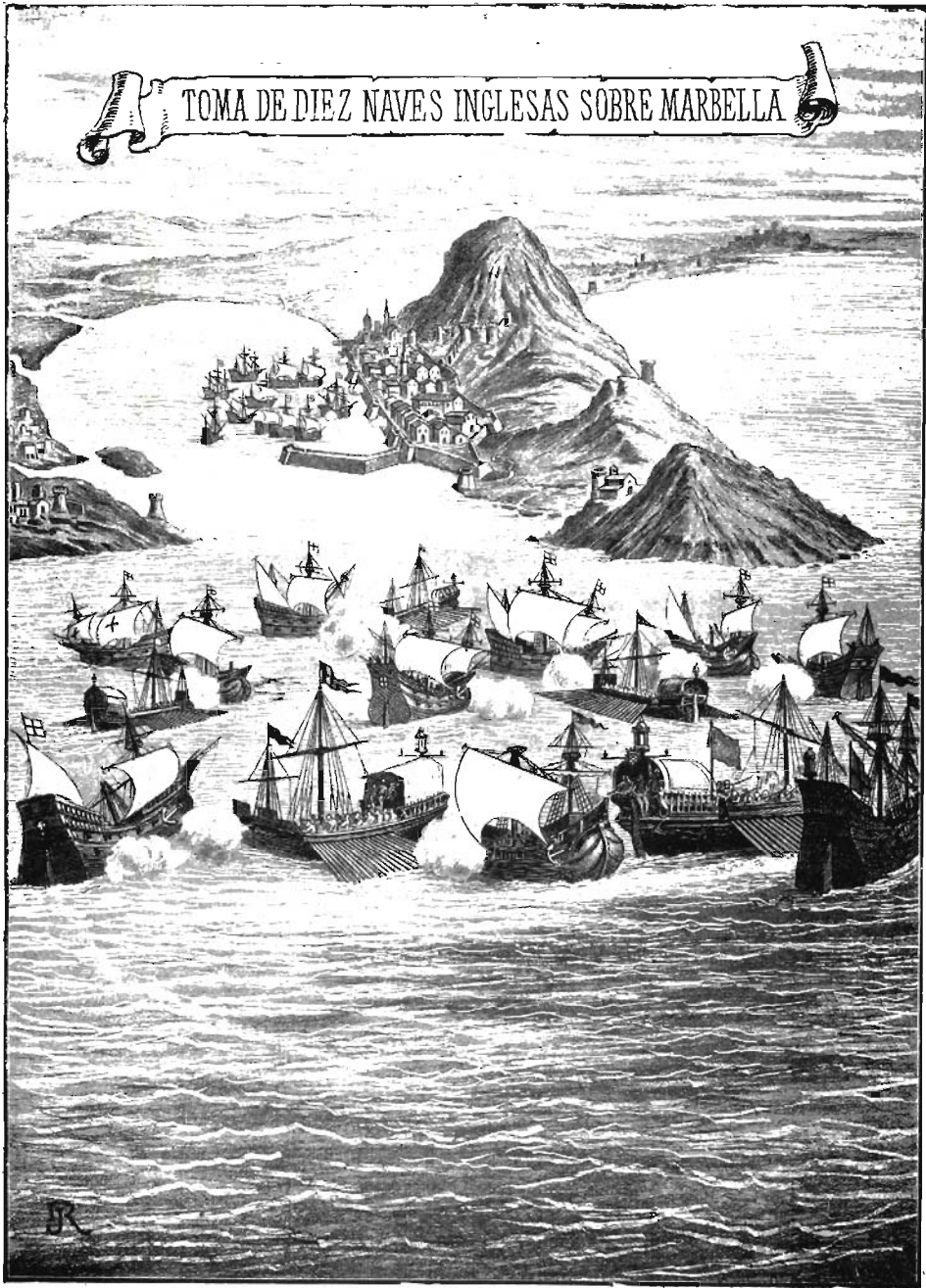
Pintura en el palacio del Viso.